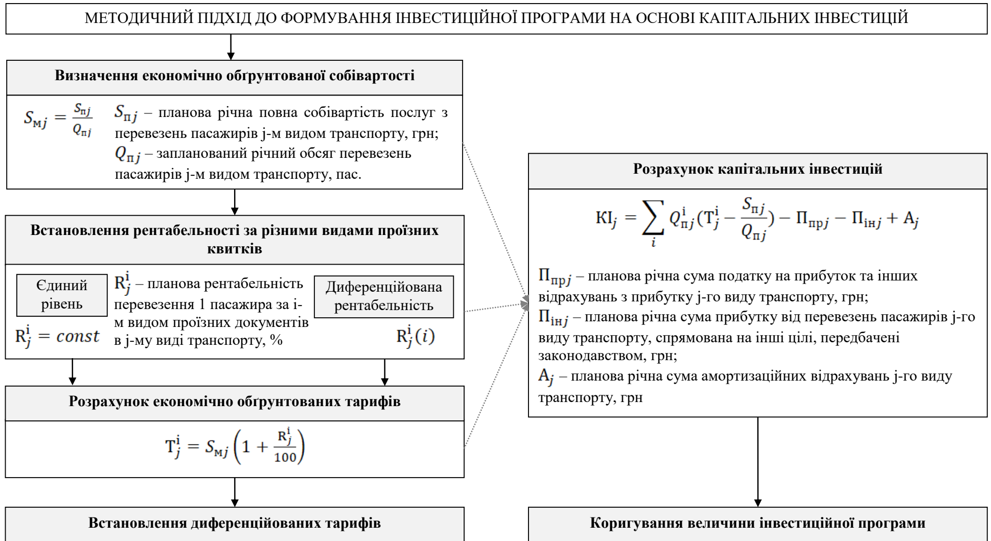
Рисунок 2 – Методичний підхід до формування інвестиційної програми на основі капітальних інвестицій